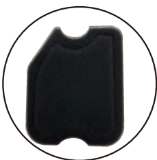
專用濾棉 Air Cleaner 厚度 21mm