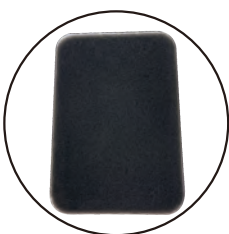
專用濾棉 Air Cleaner