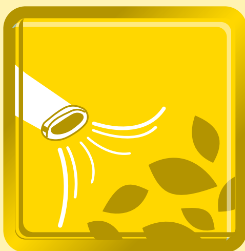
吹葉機 Engine Blower

Whole New Engine Design , Powerful Fan Output , Double Filtration System , Best Efficiency and Life